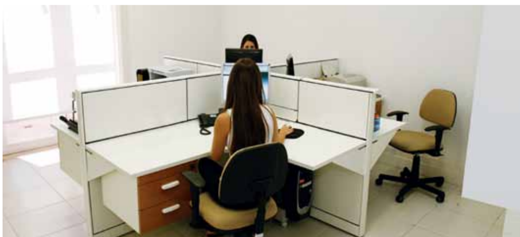
Um ambiente harmonioso no departamento de Recursos Humanos refletiu no trabalho dos colaboradores.