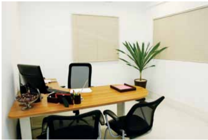
Um ambiente de trabalho mais confortável e sofisticado demonstra a profissionalização da Nogal.

“Os móveis da Alberflex além de duráveis, aliam conforto e praticidade, proporcionando aos ambientes, peças com design moderno e um toque de leveza.”