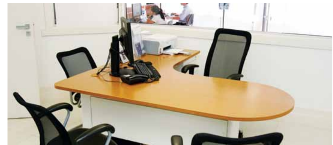
As mesas e cadeiras da Alberflex proporcionaram ao departamento de Vendas modernidade e requinte.