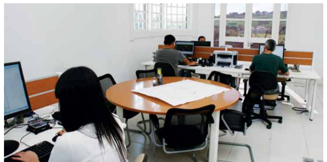
O novo ambiente do departamento de Engenharia facilitou a comunicação e o estreitamento das relações com as estações de trabalho.