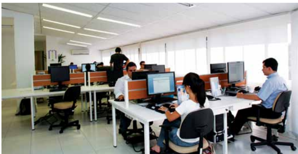
As estações de trabalho lineares da linha 900 com divisor frontal em lâmina de madeira e perfis de alumínio para instalação de acessórios deram maior privacidade e segurança de informações no departamento de Desenvolvimento de Softwares.